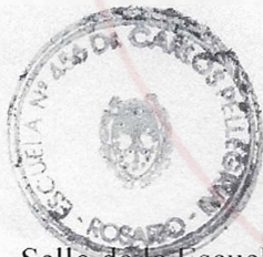
Sello de la Escuela

[Signature] NILDA A. GNESETTI DIRECTORA Escuela Nº 456