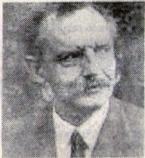
Dr. Carlos Vaz Ferreira

"No hay un ejercicio mental que ponga en acción más numerosas y más elevadas funciones mentales que el juego del ajedrez; la atención, la imaginación, el poder de combinación, son sometidos al más fuerte y disciplinado de los trabajos; el ajedrez debería ser, teóricamente, un poderoso medio de cultura intelectual;" sin embargo... y Vaz cita a Diderot